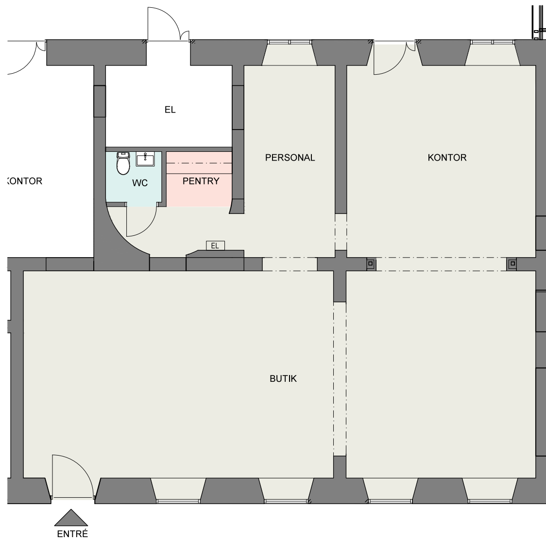
PLAN SKALA 1:100 (A3)