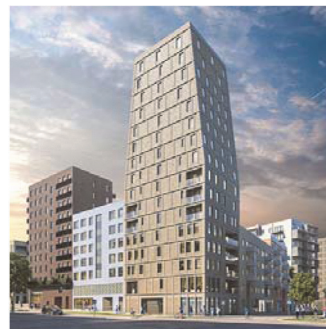
VISUALISERING Arkitekt Sandell Sandberg

RUMSHÖJD 4380 mm (till uk bjälklag), 2950 mm (fläktrum)