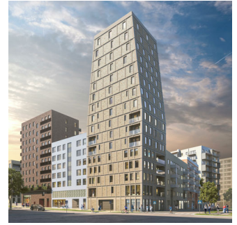
Visualisering. Avvikelser kan förekomma.