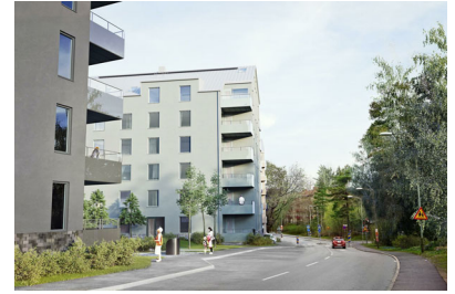
Visualisering. Avvikelser kan förekomma.