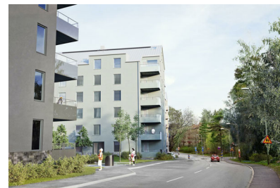
Visualisering. Avvikelser kan förekomma.