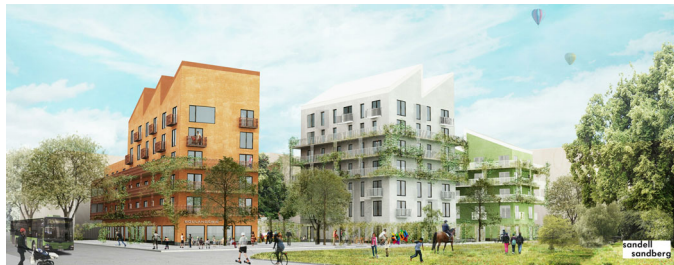
Visualisering. Avvikelser kan förekomma.

LÄGENHET NR: 0214 ANTAL RUM: 1 RoK STORLEK: ca 46 m 2