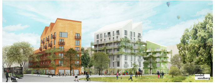
Visualisering. Avvikelser kan förekomma.

LÄGENHET NR: 0354 ANTAL RUM: 1 RoK STORLEK: ca 36 m 2