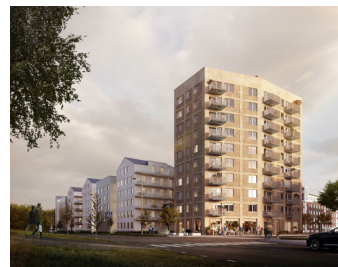
Visualisering. Avvikelser kan förekomma.

LÄGENHET NR: 1804 ANTAL RUM: 1 RoK STORLEK: ca 33 m 2