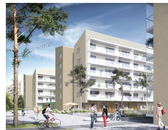
Visualisering. Avvikelser kan förekomma.

LÄGENHET NR: 0245 ANTAL RUM: 1 RoK STORLEK: ca 35 m 2