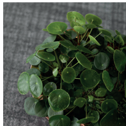
Elefantörat växer inte vilt i Kallebäck men gärna på kontoret. Förökas med sticklingar.